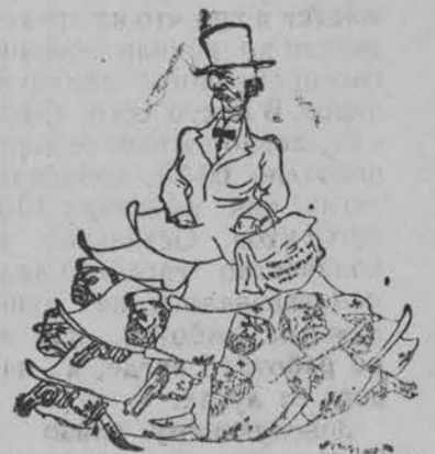
„Комитет по невмешательству“.