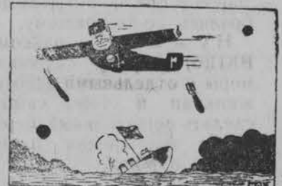
Проценты по займу. ...Англия намерена предоставить заем Италии... ...Итальянские самолеты обстреливают торговые английские пароходы... (Из газет).