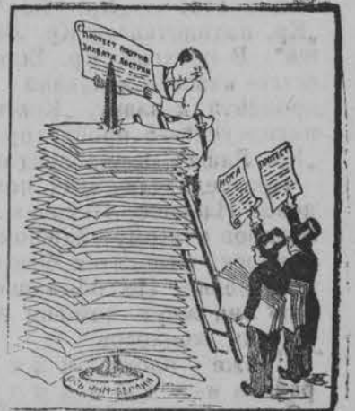
—Пока у этих господ руки заняты бумажками, они безопасны...