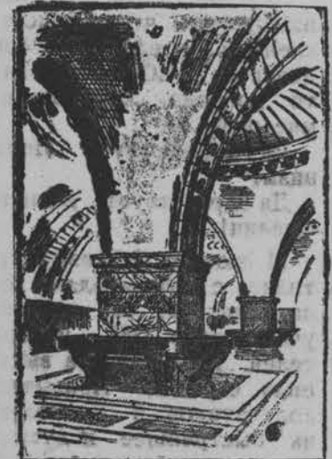
На строительстве горьковского радиуса Московского метрополитена.