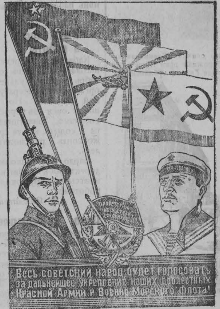
Весь советский народ будет голосовать за дальнейшее укрепление наших доблестных Красной Армии и Военно-Морского Флота!