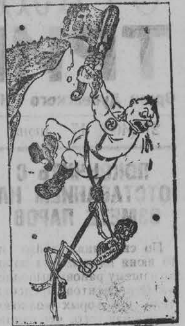
—Если ты меня не отпустишь, я тебя ударю топором.