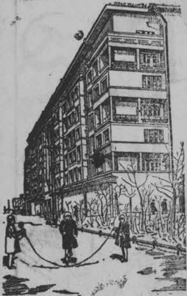
На снимке: Новый жилой дом автозавода имени Сталина по Симоновскому валу в Москве.