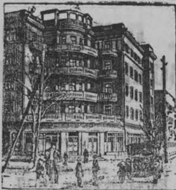
На снимке: Новый 85-квартирный дом в Ростове-на-Дону для водников Донского речного пароходства.