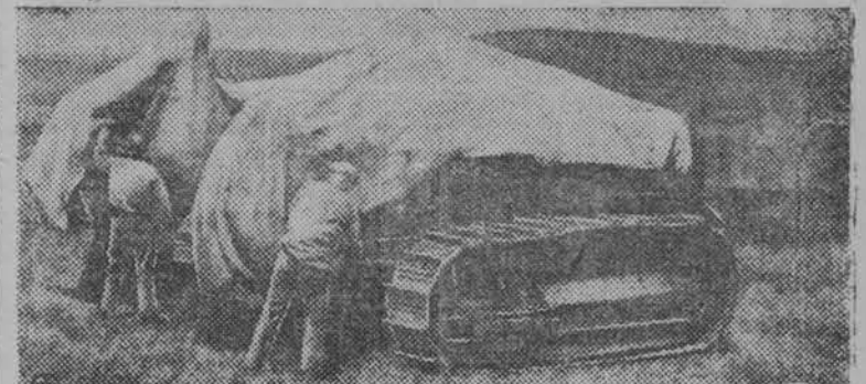
Снимкасонть: Азово-Черноморской краенъ, Ташто Минской МТС-нь трактористтиз вельтитъ трактортизненъ брезентеь