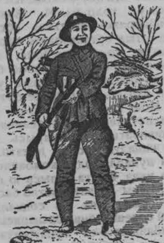
Суред вылын: Китайысь кышномурт. Армие со добровольно мынэ.

Сучжось одйг кышномурт, китайской воинской поезд'ёслэн ветлэмзы сярись японец'ёслы информировать карыса улэмез понна, аслэсьтыз картсэ выдать кариз. Со кышномурт, картсэ сыче предательской ужлэсь дугдыны косыса улиз. Солэн верамез юрттымтэ бере, картэзлэн шпионить каремез сярись китайской властьёслы вераз со. Шпионез властьёс ыбызы. Собрере со нылкышнолэсь иськавын'ёсыз юало, карттэ жаласькод-ашуыса. Со вера, мон картме предателез ышти ке но, со понна асьме странаысьтымы трос граждан-