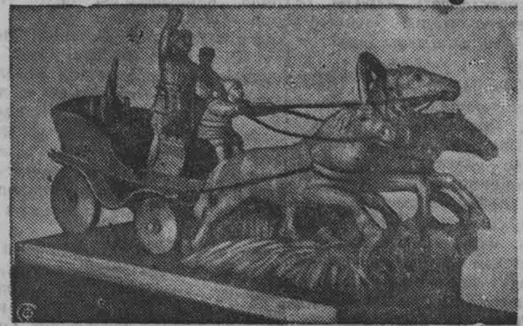
„Чапаев тачанканын“. Красить карымтэ пу вылын лэсьтэмын. Богородскысь профтехшколаын лэсьтэмын.