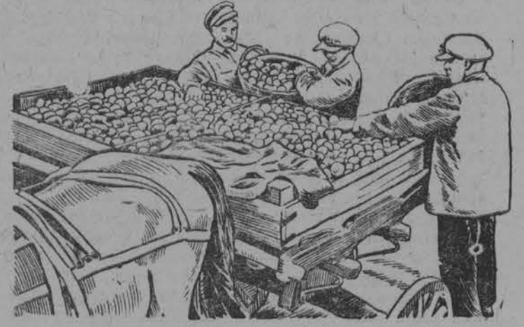
Kolxoźniki Poltevekovog kolxoza „Denı urıoşan“ (Rıbnovskıy p-n., Mosk. obl.) ođadı kartofelı v oçet kartofel-polestavok.

Rajdorotdelə kolə etnə-zə lunnezə ləşetnı possez.