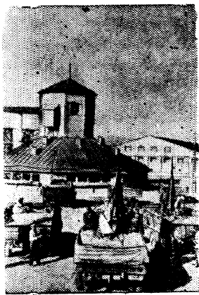
УЗБЕКСКАЯ ССР. Колхозы и совхозы республиканского подчинения начали сдачу государству пшеницы нового урожая.