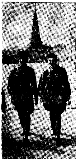
Депутаты Верховного Совета СССР Герои Советского Союза А. В. Беляков (слева) и С. А. Давыдов.