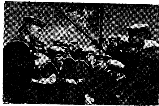
Группа моряков одного из кораблей Черноморского флота за изучением материалов XVIII съезда ВКП(б).

Американская печать дает пространственные сообщения из Москвы о работах Третьей Сессии Верховного Совета СССР.