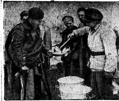
Эвакуируемые из Каталонии больные и раненые бойцы испанской республиканской армии во Франции. На снимке: раненые бойцы получают пищу в пограничном городке Булю.

На снимке: композиторы Дмитрий и Даниил Покрасс среди красноармейцев.