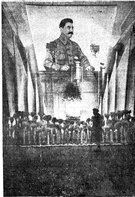
На территории строительства Всесоюзной сельскохозяйственной выставки (Москва).

Не достигнуто соглашения по вопросу об основах работы комиссии по демаркации. Посол Сигемицу предлагал положить в основу также другие материалы, которые до сих пор советскому правительству не были представлены и о которых оно поэтому не имеет никакого представления. Г. Сигемицу обещал, однако, записаться по этому вопросу свое правительство и дать в ближайшее время ответ. (ТАСС).