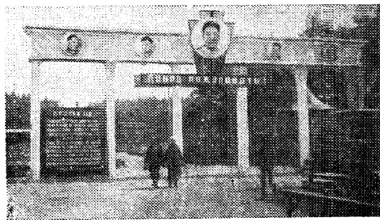
На снимке: вход в парк завода

Закончившаяся на днях сессия Совета Лиги наций обсуждала ряд вопросов исключительной важности: абиссинский и испанский вопросы, обращение китайского правительства и вопрос о нейтралитете Швейцарии.