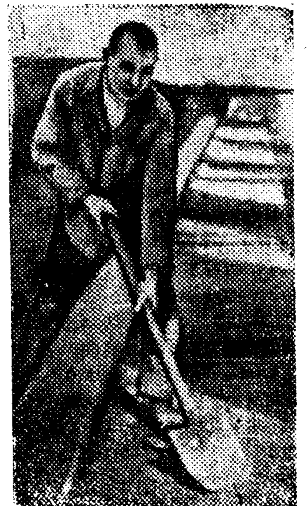
Стхановец т. ПОПОВ заканчивает бетонирование в цехе полимеризации № 4