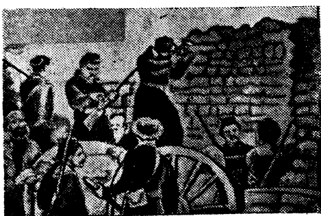
Баррикады в 1871 г. в гор. Париже

Рабочий - переплетчик, выходец из крестьянской семьи. Основатель первого в Париже профессионального союза переплетчиков. Видный деятель 1 Интернационала. В 1870 году из-за полицейских репрессий эмигрировал в Бельгию. Член центрального комитета национальной гвардии, член финансовой комиссии Коммуны. Активный организатор обороны Коммуны от версальцев. Был схвачен версальцами по доносу одного священника и после зверского избития и мучительных издевательств расстрелян без суда и следствия.