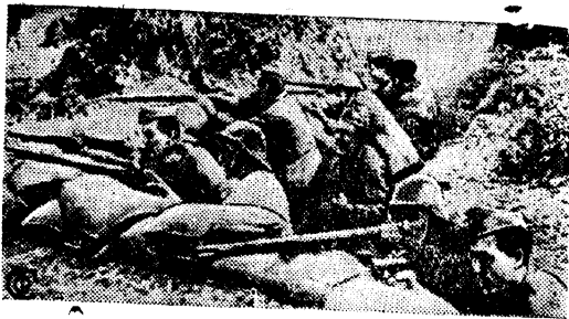
Бойцы правительственных войск в окопах на Мадридском фронте