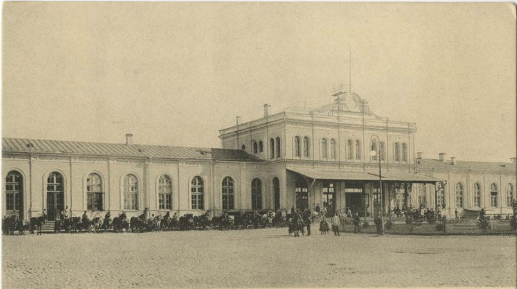
Вильна.—Вокзалъ Сѣв.-Зап. ж. д.