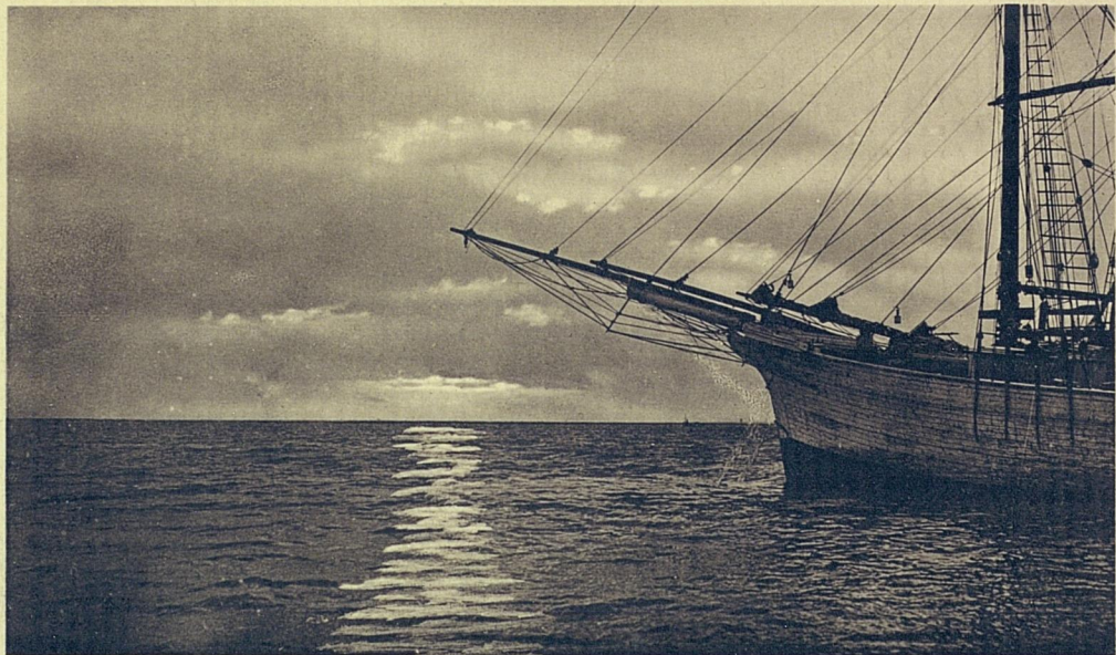
Вакатъ на Тьмалъ моръ