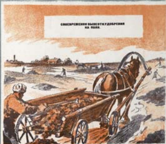
СОВРЕМЕННО ВЫШЕШЬ ДОПРЯЖИ НА ПОЛЕ.

С КАЖДЫМ ДНЕМ ПРИБЛИЖАЕТСЯ ГОРЯЧАЯ ВЕСЕННЯЯ ПОРА. ПРИБЛИЖАЕТСЯ ВРЕМЯ ВЕСЕННЕГО СЕВА. КАЖДЫЙ КОЛХОЗ, КАЖДАЯ БРИГАДА, КАЖДЕ ЗЕЛЮ ДОЛЖНЫ ВСТРЕТИТЬ СЕВ В ПОЛНОЙ ГОТОВНОСТИ.