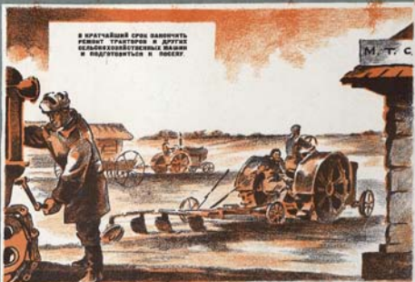
В КРАТЧАЙШИЙ СРОК ВАЖНОСТЬ РЕМОНТ ТРАКТОРОВ И ДРУГИХ СЕЛЬСКОХОЗЯЙСТВЕННЫХ МАШИН И ВОДОУБОЛЫВАТЬ И ПОСЛЕД.

С КАЖДЫМ ДНЕМ ПРИБЛИЖАЕТСЯ ГОРЯЧАЯ ВЕСЕННЯЯ ПОРА. ПРИБЛИЖАЕТСЯ ВРЕМЯ ВЕСЕННЕГО СЕВА. КАЖДЫЙ КОЛХОЗ, КАЖДАЯ БРИГАДА, КАЖДЕ ЗЕЛЮ ДОЛЖНЫ ВСТРЕТИТЬ СЕВ В ПОЛНОЙ ГОТОВНОСТИ.