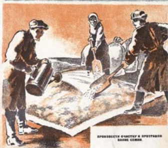
БЕЖИТЕЛИ ЧИСТЫЕ И ПРОТРАВЫ САМЫ СЕБЯ.