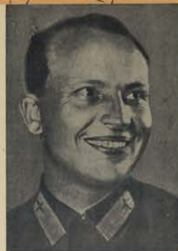
Г. Ф. БАЙДУКОВ ГЕРОЙ СОВЕТСКОГО СОЮЗА