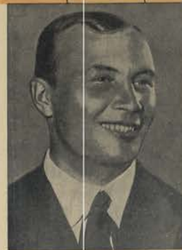
А. В. БЕЛЯКОВ ГЕРОЙ СОВЕТСКОГО СОЮЗА

ГЕРОИЧЕСКИЙ ЭКИПАЖ САМОЛЕТА „АНТ-25“ В СОСТАВЕ ГЕРОЕВ СОВЕТСКОГО СОЮЗА у.т. ЧКАЛОВА, БАЙДУКОВА И БЕЛЯКОВА, ВЫЛЕТЕВ 18-го ИЮНЯ С.Г. В 4 ЧАСА 33 МИНУТ ПО МОСКОВСКОМУ ВРЕМЕНИ СО ЩЕЛКОВСКОГО АЭРОДРОМА (БЛИЗ МОСКВЫ), ПРОЛЕТЕЛ ПО СЛЕДУЮЩЕМУ МАРШРУТУ: МОСКВА—ОМЕГА—БЕЛОЕ МОРЬЕ—КОЛЬСКИЙ ПОЛУОСТРОВ—БАРЕНЦЕВО МОРЬЕ—ЗЕМЛЯ ФРАНЦА ИСХОФА—СЕВЕРНЫЙ ПОЛЮС—ЛЕДОВИТЫЙ ОКЕАН (ПОЛЮС НЕПРИСТУПНОСТИ)—ОСТРОВ ПАТРИКА—МЫС ПИРС ПОЙНТ (СЕВЕРНОЕ ПОВЕРЬЕ КНАДА)—ПЕРЕСЕК КНАДУ (ФОРТ СИМПСОН, ШТАТ АЛЬБЕРТА, БРИТАНСКАЯ КОЛУМБИЯ), ЭКИПАЖ ПРИНЯЛ РЕШЕНИЕ ПЕРЕСЕЧЬ ЗДЕСЬ СКАЛИСТЫЕ ГОРЫ И ВЫШЕЛ НА ПОБЕРЕЖЬЕ ТИХОГО ОКЕАНА; ПРОШЕЛ ДО ЗАЛИВА УКЛЕМУИ (ШТАТ ОРЕГОН), ВЫШЕЛ НА ТЕРРИТОРИЮ США И 20 ИЮНЯ В 19 ЧАС. 30 МИН. ПО МОСКОВСКОМУ ВРЕМЕНИ СОВЕРШИЛ ПОСАДКУ НА АЭРОДРОМЕ БАРАКС, БЛИЗ ПОРТЛАНДА (ШТАТ ВАШИНГТОН).