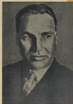
В. П. ЧКАЛОВ ГЕРОЙ СОВЕТСКОГО СОЮЗА

Самый кратчайший путь Москва — С.Ш.А. проходит через Северный полюс. Впервые в истории человечества этот путь осуществили героические перелетчики Москва — Портланд. По маршруту этого полета совершили кратчайший перелет Москва — Портланд и через Северный полюс перелетчики совершили путь через Тихий и Атлантический океаны. Таким образом, по маршруту, что самым кратчайшим путем является путь через Северный полюс.