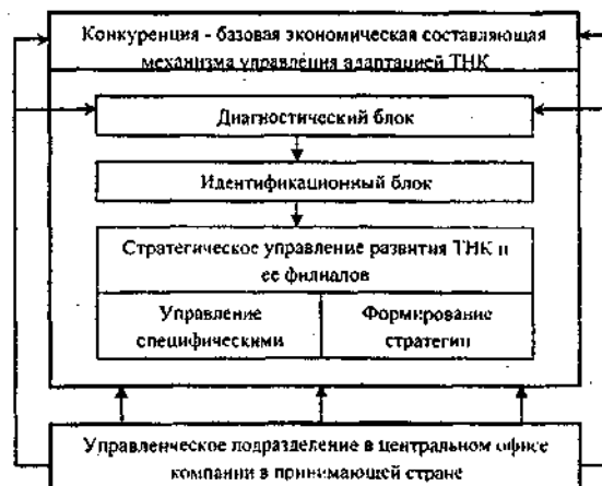
Рис.2. Модель механизма управления адаптацией ТНК

Использование модели механизма управления адаптацией ТНК позволяет разработать и следовать адаптационной стратегии ТНК при вхождении на новые рынки и развитии ее деятельности в принимающей стране.