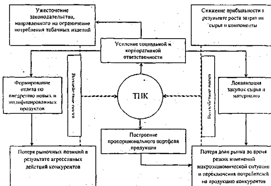
Рис. 3. Адаптационная стратегия компании «БАТ-Россия».