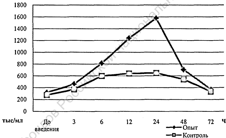
Рис 1. Динамика изменения количества СК после интрацистерального введения линдомаста

Подтверждено, что после интрацистерального введения линдомаста происходит увеличение числа СК через 3 часа в 0,7 раза (с 316,6±17,1 до 459,8±13,9 тыс/мл), через 6 ч – в 2,6; через 12 ч – в 3,9; через 24 ч – в 5,0 раз. Через 48 часов количество СК снижается практически в 2,2 раза и к 72 часам приближается к исходному уровню (368,9±30,4 тыс./мл). Полученные данные свидетельствуют о том, что интрацистеральное введение препарата линдомаста приводит к повышению числа СК (раздражающее действие), проходящее через 72 часа.