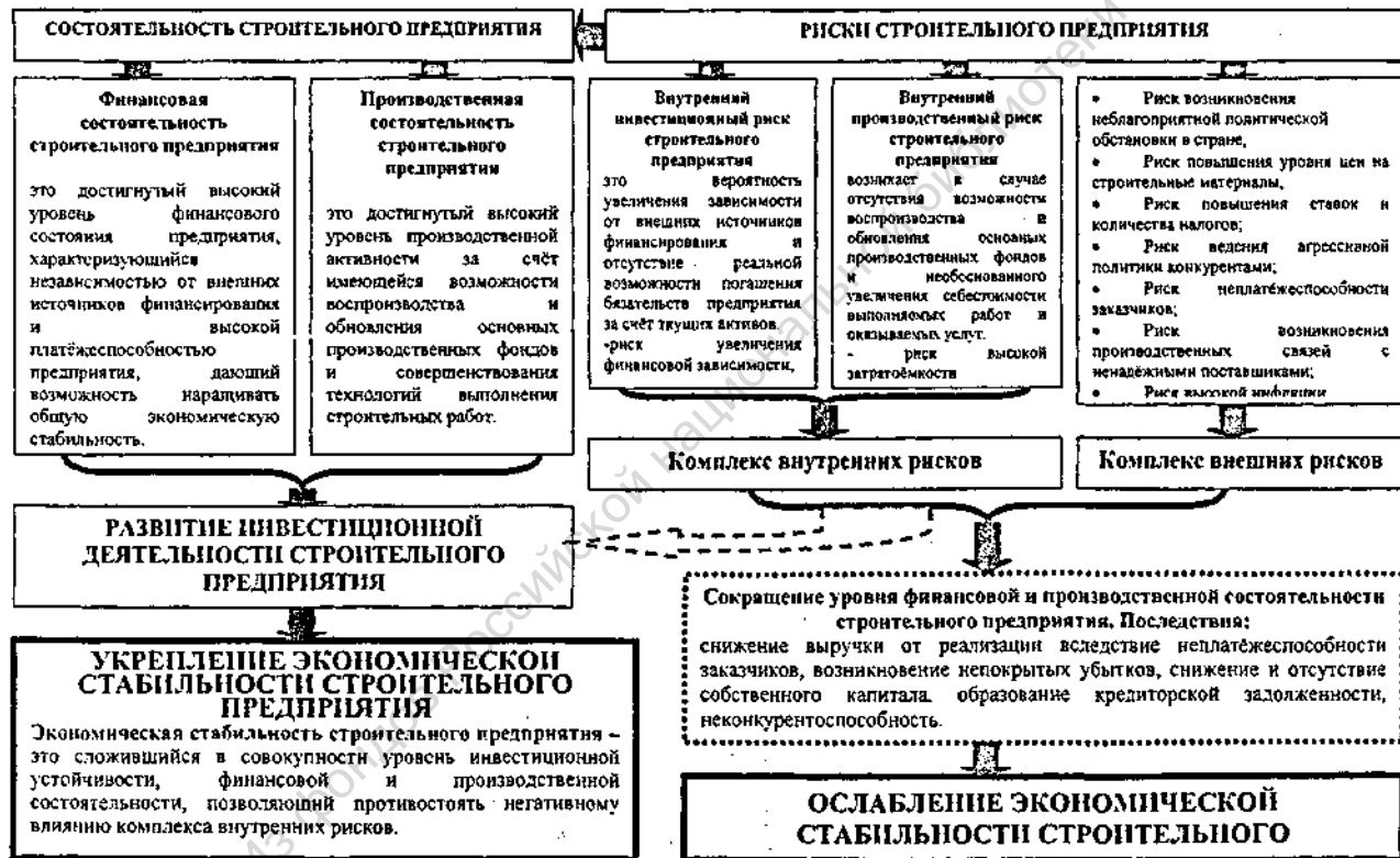
Рис. 1. Содержание и составляющие экономической стабильности предприятия ИСК