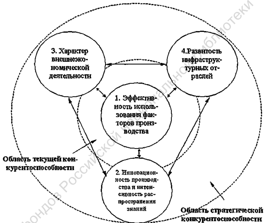
Рис. 1. Группы факторов конкурентоспособности экономики региона в условиях глобализации

Предлагается рассматривать в качестве основных факторов , определяющих конкурентные позиции субъектов РФ в современных условиях глобализации, следующие группы факторов (рис. 1).