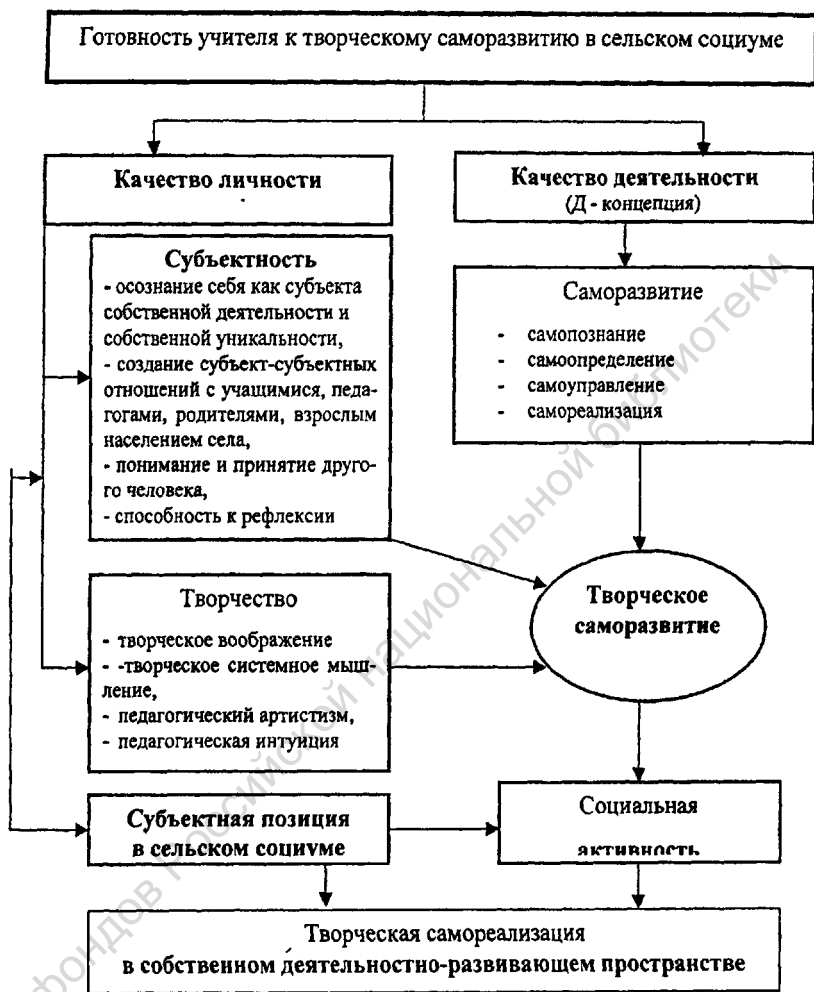
Рис. 1. Концептуальная модель готовности учителя к творческому саморазвитию в сельском социуме

В третьей главе диссертации «Системообразующее условие и факторы творческого саморазвития учителя в сельском социуме» раскрыта сущность субъектной позиции сельского учителя как системообразующего