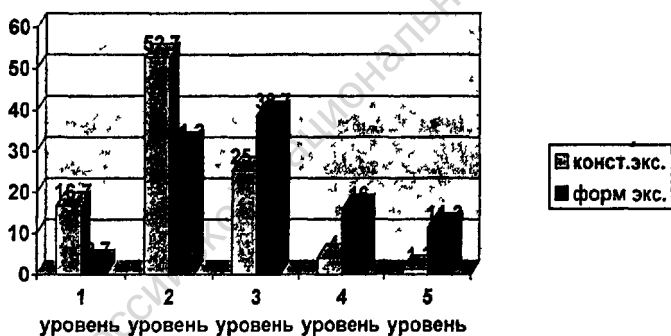
Гистограмма 1 Динамика готовности педагогов к творческому саморазвитию в сельском социуме (в %)

Видение нового образа самого себя, новых признаков и видов деятельности характерно для значительного большинства педагогов экспериментальной группы - 135 (констатирующий показатель - 84 человек). Данный факт говорит о существенном развитии творческого воображения у учителей.