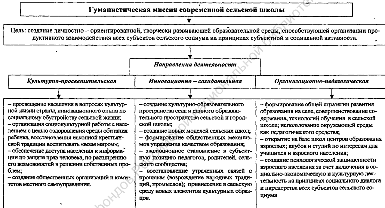
Схема 1. Гуманистическая миссия современной сельской школы