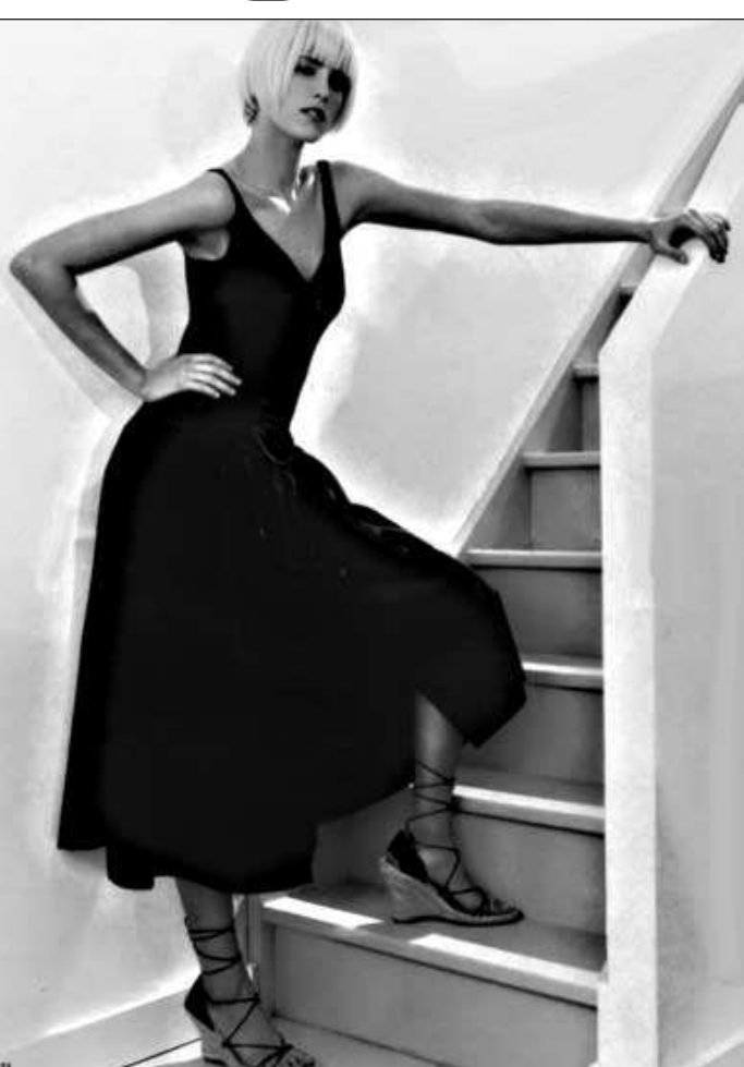
Александр Андреева На снимках: модели Max Mara.

Нынешним летом сохраняется устойчивый интерес к спортивному стилю: кроссовками и теннисным туфлям, которые теперь выпускаются под марками самых известных дизайнеров.