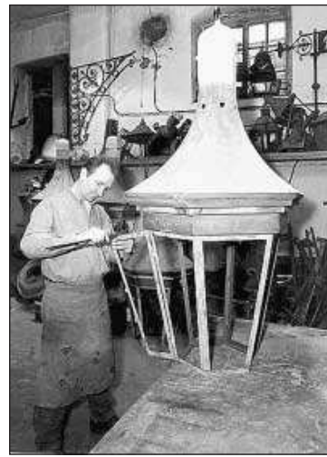
Кузнечная «составляющая» названия предполагает непременно наличие в мастерской огненного горна, молота, наковальни и собственно кузнечка.