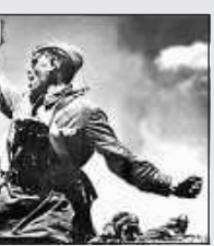
Дорогами Победы 1942 — 2002

Пробные кремации начались 10 марта, а регулярно крематорий стал работать 16 марта, когда было сожжено 150 трупов. В апреле его пропускная способность увеличилась в 10 раз. Умерших привозили из моргов (районы и при лечебных учреждениях), а после того как растаял снег, с кладбищ, где находилось много незахороненных или едва припрятанных земель трупов («подожженков», по горькой терминологии блокадных лет).