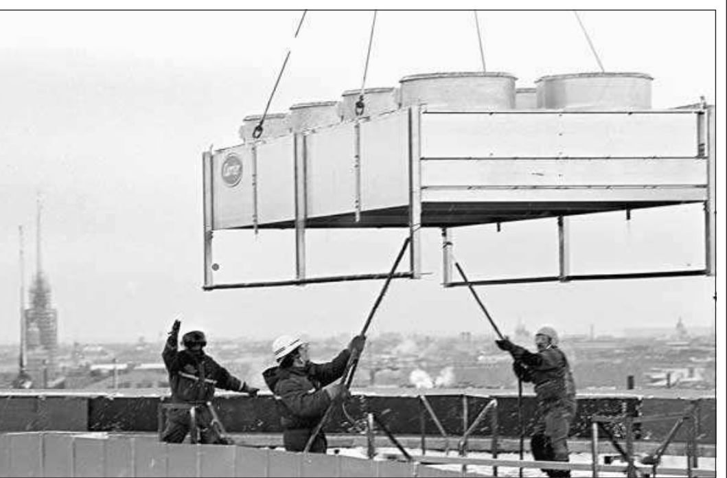
В минувшую субботу горожане вновь наблюдали за виртуозной работой вертолета авиакомпании «Спарк», пилотируемого знаменитым летчиком Вадимом Базыкиным. На крыше сооружаемого возле достройки «Санкт-Петербурга» бизнес-центра монтажники установили четыре вентиляционных агрегата, весящих каждый две тонны.